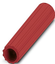
Casquillo aislante, color: rojo

https://www.phoenixcontact.com/ar/productos/0311579