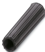
Casquillo aislante, color: negro

https://www.phoenixcontact.com/ar/productos/0311634