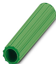
Casquillo aislante, color: verde

https://www.phoenixcontact.com/ar/productos/0311605