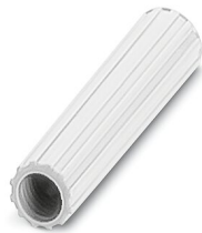
Casquillo aislante, color: blanco

https://www.phoenixcontact.com/ar/productos/0311566