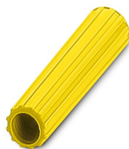
Casquillo aislante, color: amarillo

https://www.phoenixcontact.com/ar/productos/0311595