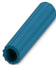
Casquillo aislante, color: azul

https://www.phoenixcontact.com/ar/productos/0311582