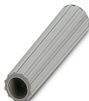
Casquillo aislante, color: gris

https://www.phoenixcontact.com/ar/productos/0311621