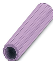
Casquillo aislante, color: violeta

https://www.phoenixcontact.com/ar/productos/0311618