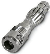
Clavija de pruebas, color: plata

https://www.phoenixcontact.com/ar/productos/0311647